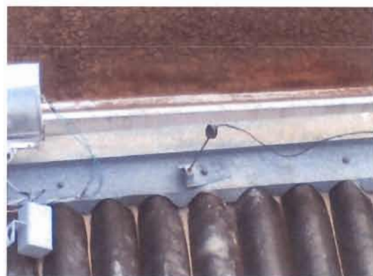
Figura 2: Cabo de aço cortado na frente sobre o Prédio de Medicina.