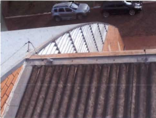
Figura 3: Vista da ligação do para-raios à gaiola de Faraday do Ginásio.