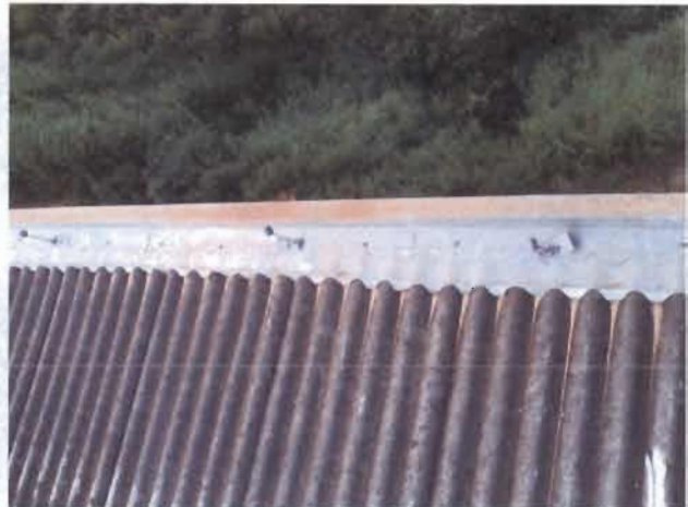
Figura 4: Isoladores sem o cabo do SPDA na parte de trás do prédio.