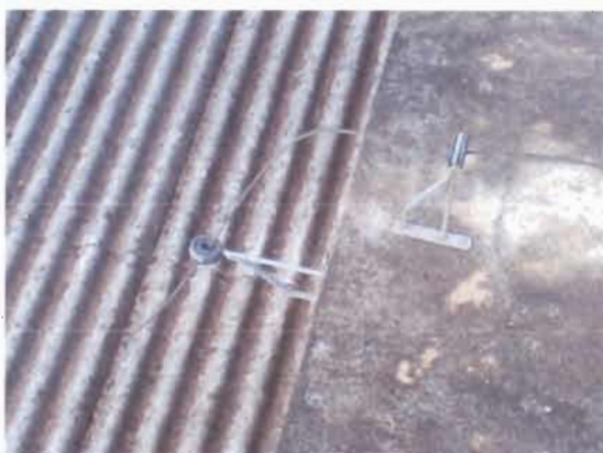
Figura 1: Descida interrompida do para-raios.

O SPDA do Prédio de Medicina está parcialmente sem os cabos e estes sem conexão. Conforme verificamos nas fotos abaixo, faz-se necessário a instalação de cabos e a respectiva conexão ao para-raios e às descidas de aterramento. Da forma que se encontra atualmente, não oferece proteção contra descargas atmosféricas.