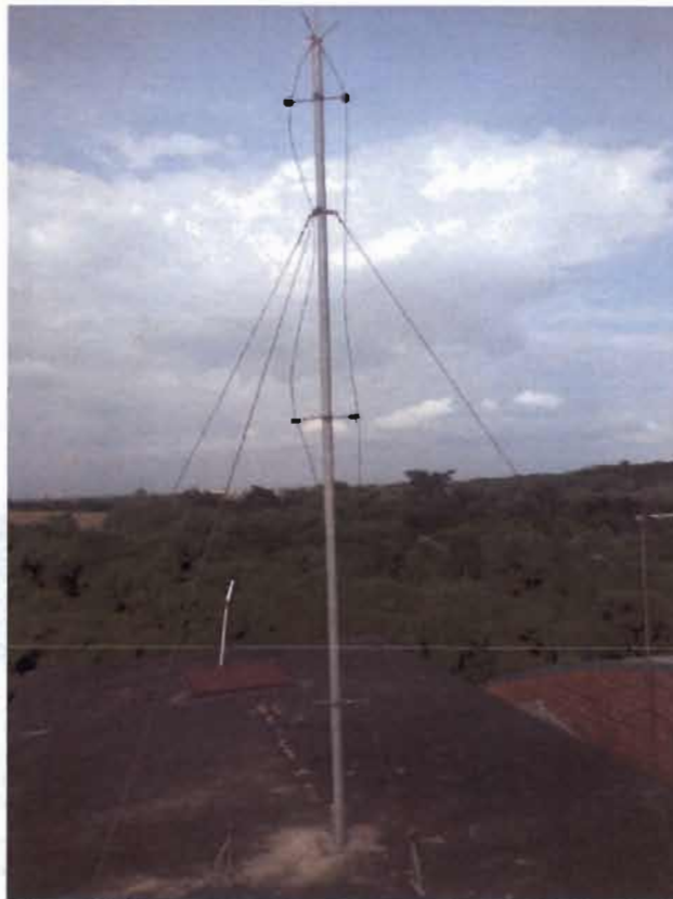
Figura 5: Para-raios sobre o reservatório do Prédio de Medicina, com 2 descidas do captor.

Handwritten signature and initials in blue ink, located in the bottom right corner of the page.